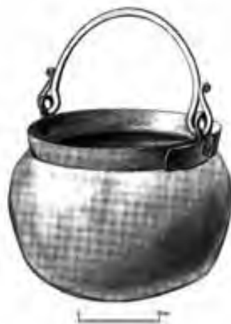
Török kori bogrács rajza