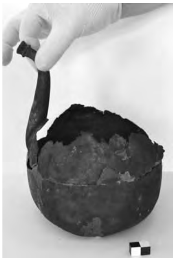
Töredékes török kori ibrik)

zatos egyesülést célzó éjszakai szertartásaikon ( zikr ) elűzzék az álmat és a fáradságot. Az ital a vallási közegekből kikerülve hamar ismertté és népszerűvé, egyúttal közösségformáló erővé vált a XVI. században megnyíló kávéházak által, melyeket a különböző társadalmi rétegek más-más okból kerestek fel. Az elit kvázi irodalmi szalonként tekintett a kávéházakra, ahol felolvasásokat, vitaesteket tartottak saját verseikből. Az alacsonyabb társadalmi csoportokat inkább a játékszenvedély csalogatta be ezekben az intézményekbe, hogy a különféle szerencsejátékok által egy kis pénzhez jussanak. Viszont a kávéház tulajdonosai a szórakoztatásra koncentráltak: árny- és bábjátékosokat, zenészeket, mesemondókat fogadtak fel. Utóbbiak az általunk is ismert Evlia Cselebi szerint már a XVII. században önálló céhbe tömörültek, tehát igazi mesterembereknek tartották őket akkoriban.