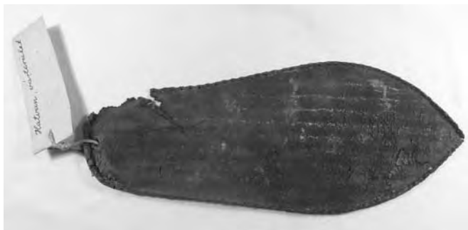
A hatvani vár egykori területén talált 1. típusú cipőtálp)

„Érdekes leletre bukkantak a munkások a szennyvíz levezető csatorna árkának ásásakor a volt várterület részén, a régi Lakatos ház udvarán. A föld kitermelése közben, 2 m-től kezdve, az ásó nyomán vékony bőrlemezek kerültek elő a birkatrágyás rétekből: a hatvani török várvédők és török lakóinak bocskortálpai. Ezek a megpatkózott, megszőgelt közel 400 éves bocskortálpak a török-kor emlékei.” 1