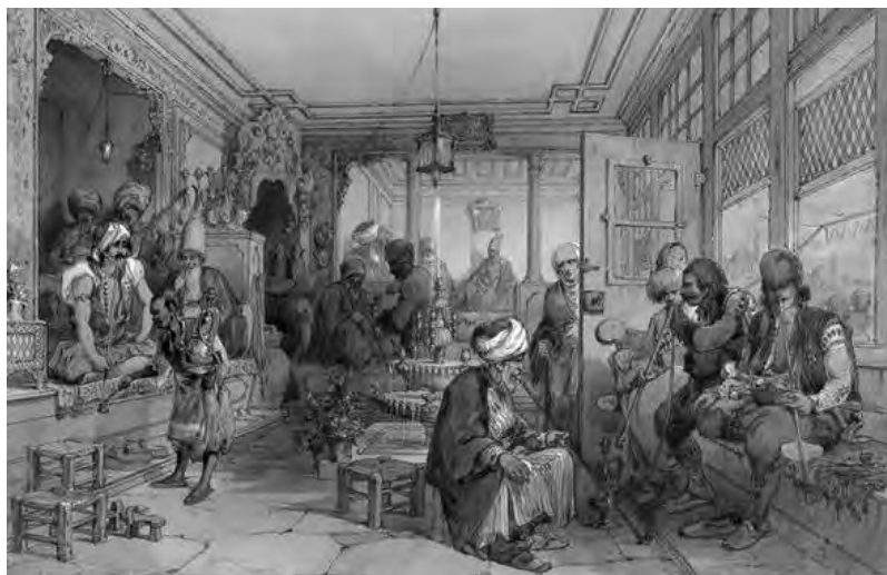
Egy török kávéház ábrázolása

Visszatérve a tárgyi emlékekre, a törökök háztartási felszereléseiről írásos források is maradtak ránk. Az adóösszeírásokban és a hagyatéki leltárakban rendre beszámolnak egy-egy tulajdonos mekkora javakat halmozott fel élete során. Ezekből a leírásokból következtethetünk egy átlagos török háztartás edénykészletére, amely a következő elemekből állt: a fém-